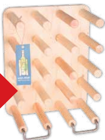
31 x 39,5 cm: 16 flessen € 75,-