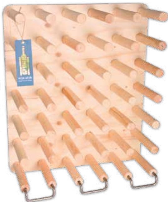
48 x 56,5 cm: 36 flessen € 120,-